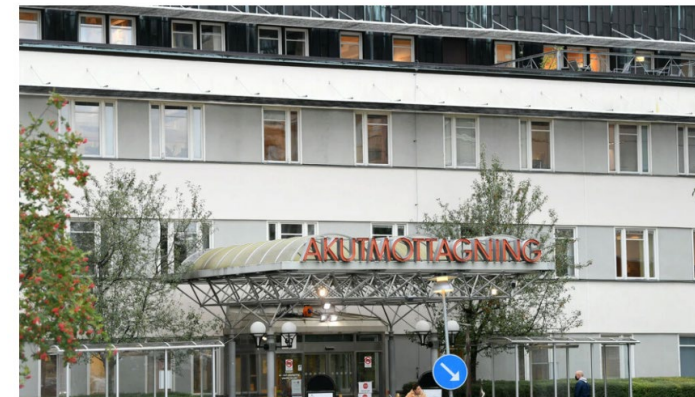
Akademiska sjukhuset i Uppsala är fortfarande drabbat av hackarattacken den 20 januari.