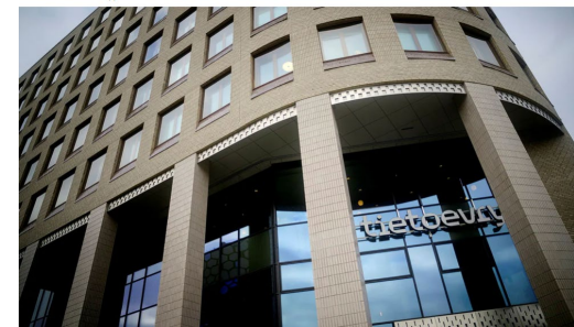
I utlösen med Tietoevry ingick att hålla säker backup enligt kundens.

Uppdaterad 2024-02-16 Publicerad 2024-02-14